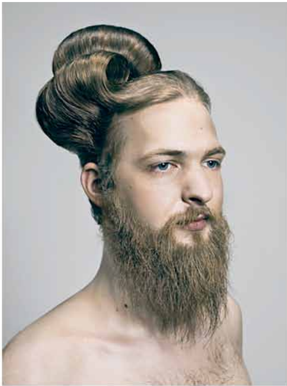
↑ Zweiter Platz: © Per Schorn: Haare – Schorn in Darmstadt Kommunikations-Design studiert und arbeitet seit etwa 2 Jahren als Fotograf im RM-Gebiet.